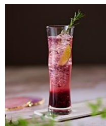
オリジナルドリンクイメージ

料 金：1名様 大人 38,355円～ お子様（5歳～小学生） 26,848円～