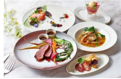
ディナーイメージ

*7/23～は夏のメニュー、9/1～は秋のメニューを提供いたします。詳しくはホテルまでお問い合わせ下さい。