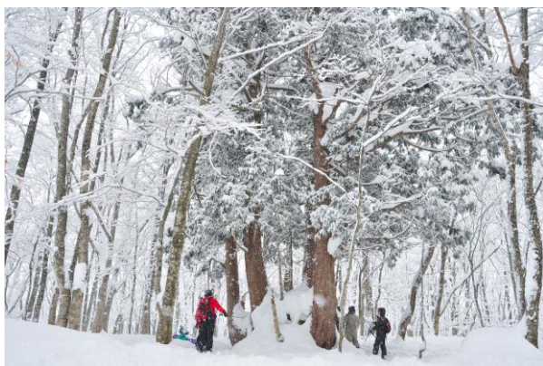
スノーシューツアーイメージ