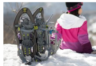
スノーシューイメージ

雪の上を効率よく歩くためにスノーブーツに装着する西洋版のかんじき「スノーシュー」やストックなどのアイテムを使って楽しむ雪上ハイキング。スノーブーツだけでは行くことができないふかふかの雪が降り積もった幻想的な場所へも繰り出すことができ、動物の足跡を見つけてみたりなど、お子様から大人まで気軽に楽しむことができます。