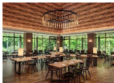
Dining & Bar LAVAROCK