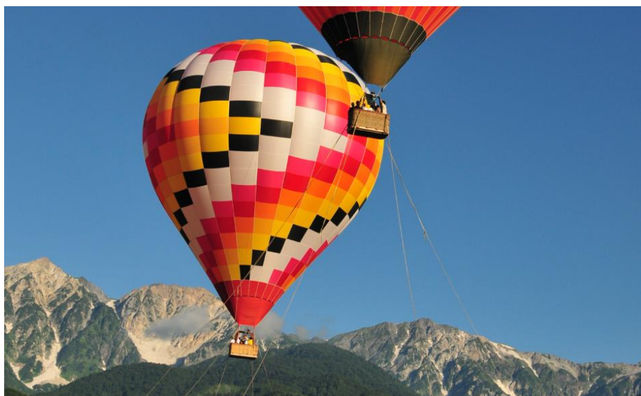
Explore the Nature イメージ