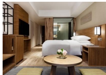
温泉付 プレミアールーム (キング)

料 金： ・Aコース：1名様 31,490円～ お子様 23,210円～ ・Bコース：1名様 29,170円～ お子様 21,440円～ ・Cコース：1名様 30,240円～ お子様 23,270円～